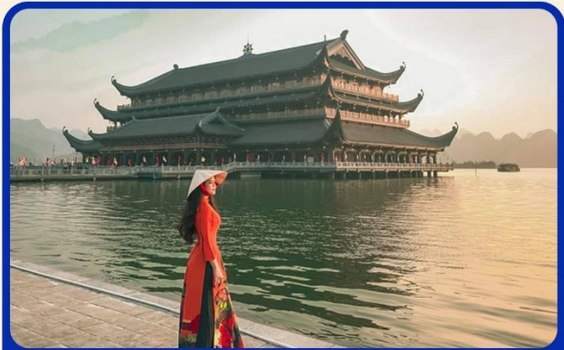
จุดเชคอินแห่งใหม่ “วัดตามจ๊ก”