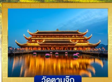
วัดตามจ๊ก