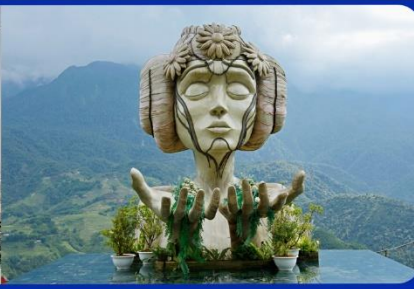
เชคอิน โมอาน่า (Moana Sapa Cafe)