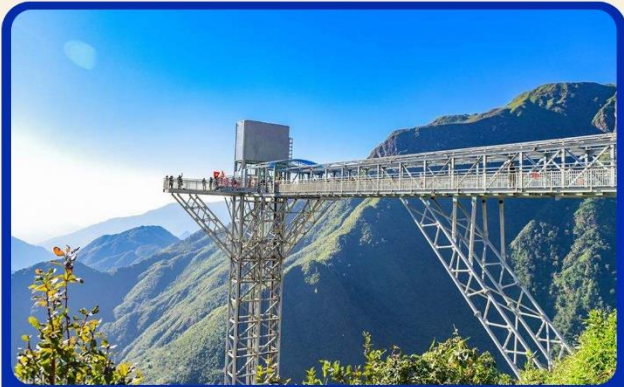
สะพานแก้วมังกรเมฆ (Rong May Glass Bridge)