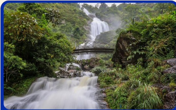
น้ำตกสีเงิน (Silver Water Fall)