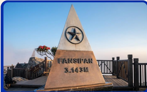
นั่งกระเช้าสู่ยอดเขาฟานซิปัน