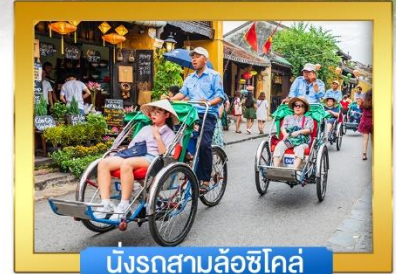
นั่งรถสามล้อช็อคโกแลต