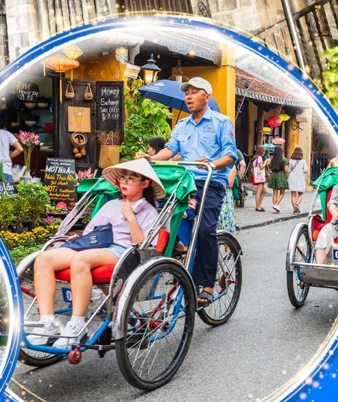
นั่งรถสามล้อฮิโคล่

พักผ่อน บานาฮิลล์ 1 คืน นั่งกระเช้าที่ยาวที่สุดในโลก ขึ้นสู่บานาฮิลล์ ชมเมือง ฮอยอัน เมืองมรดกโลกที่สวยงามและเจียบสงบ พิเศษ!! บุฟเฟต์นานาชาติ บานาฮิลล์