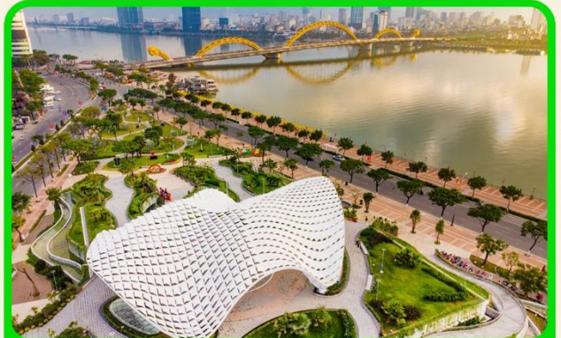
เช็คอิน แหล่งที่เที่ยงใหม่ APEC PARK