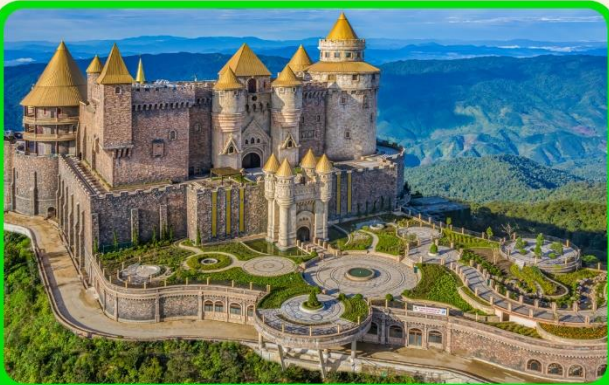
เที่ยวบานาฮิลล์แบบจุใจ เต็มวัน