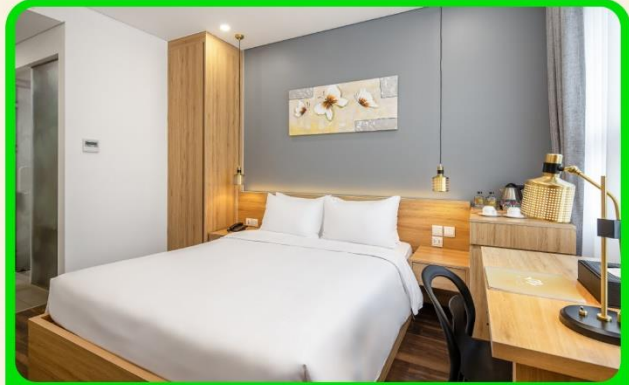
พักเมืองดานัง 4 ดาว 3 คืน