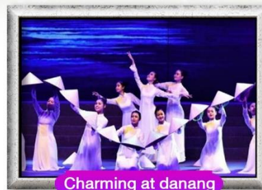
Charming at danang