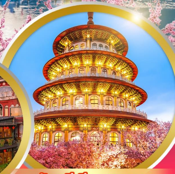
วัดอูจี้เทียนหยวน

ชมอนุสรณ์สถานเจียงไคเช็ค ขอความรักวัดหลงซาน ชมตึกไทเป 101 ล่องเรือทะเลสาบสุริยันจันทรา วัดเหวินหู่ ซุปปิ้งจู้ใจ 3 ตลาดชื่อดัง เมนูเด็ด..ชาบูบุฟเฟ่ต์สไตล์ไต้หวัน เสียวหลงเปา