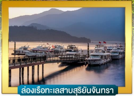
ล่องเรือทะเลสาบสุริยนจินทรา