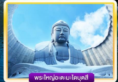
พระใหญ่อะตะมะไดบุตสึ