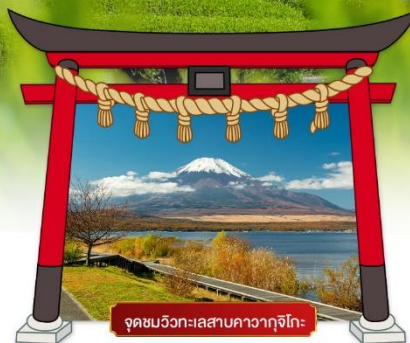
จุดชมวิวกะเลสาบคาวากูจิโกะ