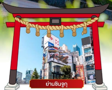
ย่านชินจูกุ

เดินทางโดยสายการบิน : ไทยแอร์เอเชียเอ็กซ์