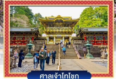
ศาลเจ้าโทโชกุ