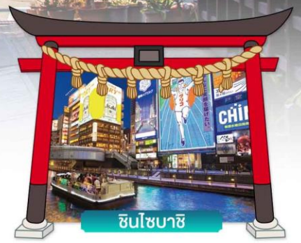
ชินโซบาชิ