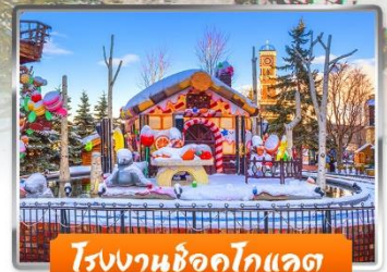
โรงงานช็อกโกแลต