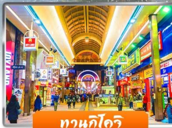
ทานุกิโคจิ