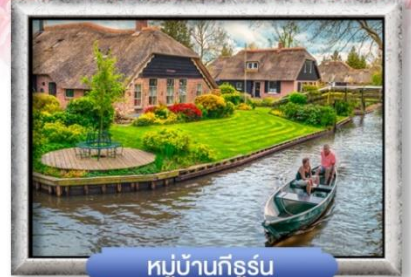
หมู่บ้านทีจอร์น

เมนู พิเศษ! หอยแมลงภู่มื้อไวน์ขาว, ล่องเรือหลังคากระจก