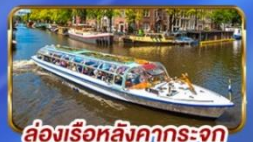
ล่องเรือหลังคากระจก