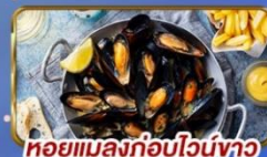
หอยแมลงภู่อุ่นไวน์ขาว