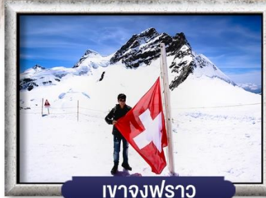
เวาจุงฟราว