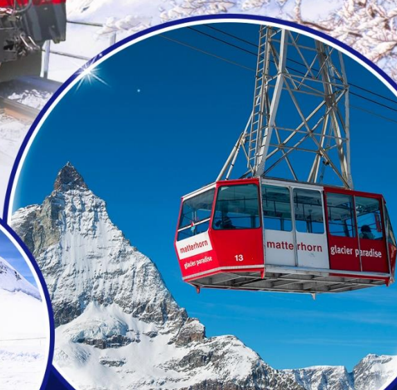
Matterhorn glacier Paradise