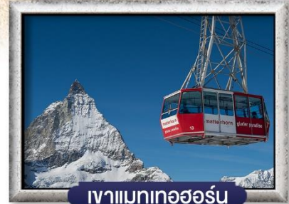
เวาแมทเทอฮอร์น