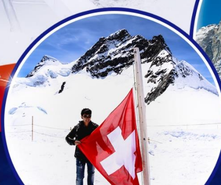
เขาจุงฟราว ใหม่! ขึ้นกระเช้า ลงรถไฟ