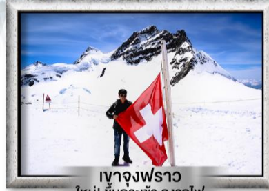
เขาจุงเฟรา ใหม่! ขึ้นกระเช้า ลงรถไฟ