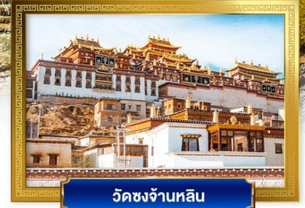
วัดชงจ้านหลิน