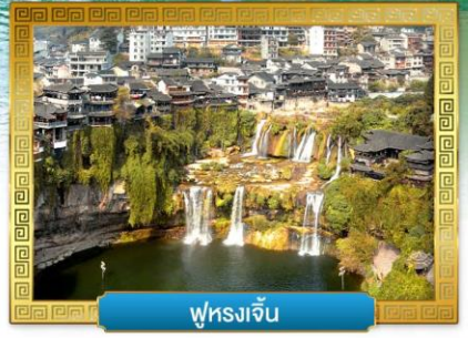
ฟูรงเจิน