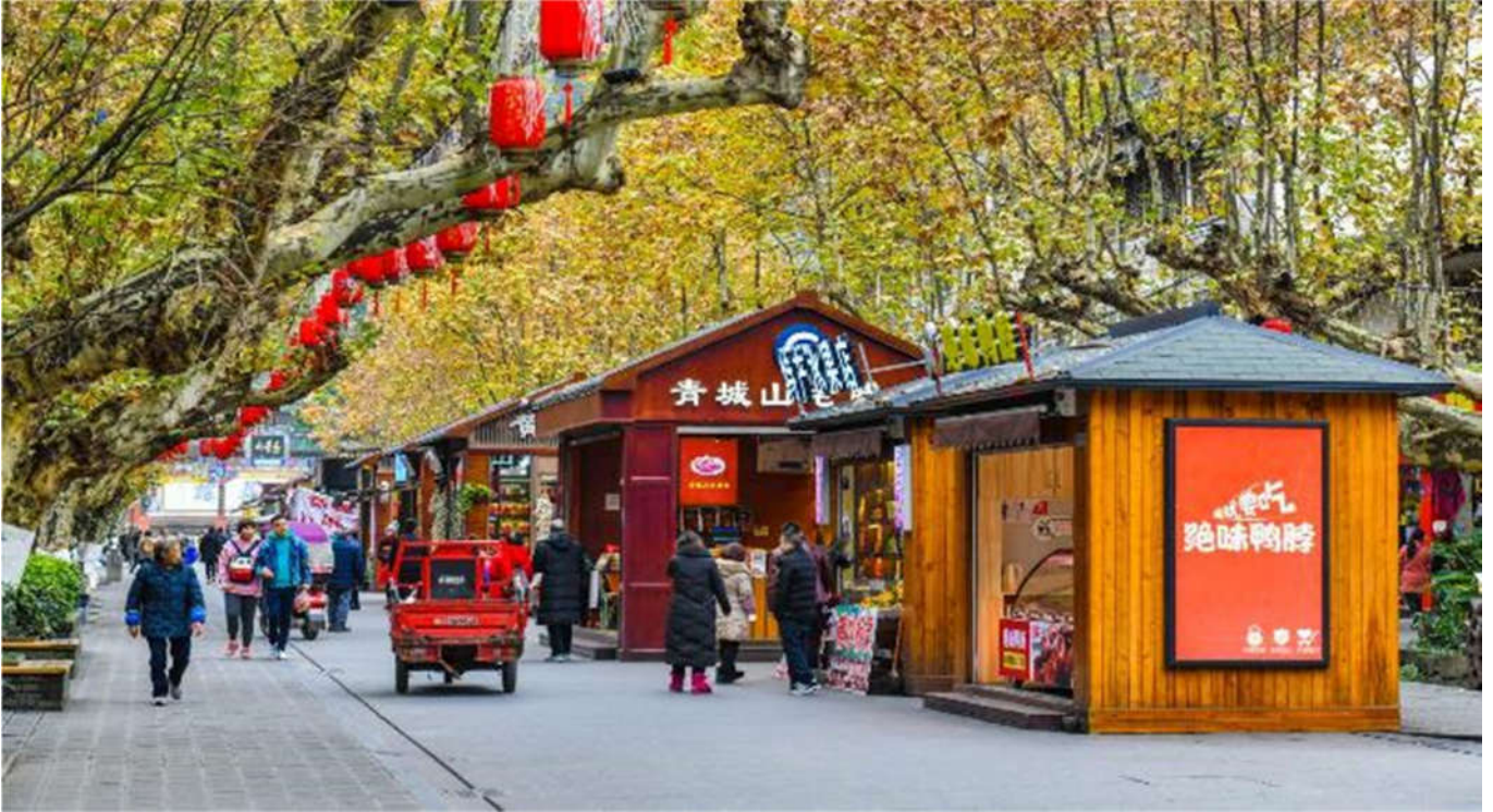
กลางวัน บริการอาหารกลางวัน ณ ภัตตาคาร (2)

นำท่านเดินทางสู่ เมืองจิวจ้ายโกว (Jiuzhaigou) (ใช้ระยะเวลาเดินทางโดยประมาณ 8 ชั่วโมง) เมืองจิวจ้ายโกวตั้งอยู่ที่จังหวัดอาป่า ทางภาคตะวันตกเฉียงเหนือของมณฑลเสฉวน อยู่ห่างจากเมืองเฉิงตูประมาณ 330 กิโลเมตร แต่เดิมนั้นเมืองจิวจ้ายโกวมีหมู่บ้านชาวทิเบตอยู่ 9 หมู่บ้าน อาศัยอยู่ริมธารน้ำเหล่านี้ เนื่องจากชาวทิเบตนับถือภูเขา ธารน้ำ เพราะเหตุนี้จิวจ้ายโกวจึงได้รับการเคารพจากชาวทิเบตว่าเป็น “ขุนเขาธารน้ำอันศักดิ์สิทธิ์”